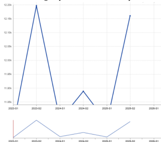
Productieramingingen voor runderen in Frankrijk, per duizend stuks

Productieramingingen voor runderen in EU, per duizend stuks