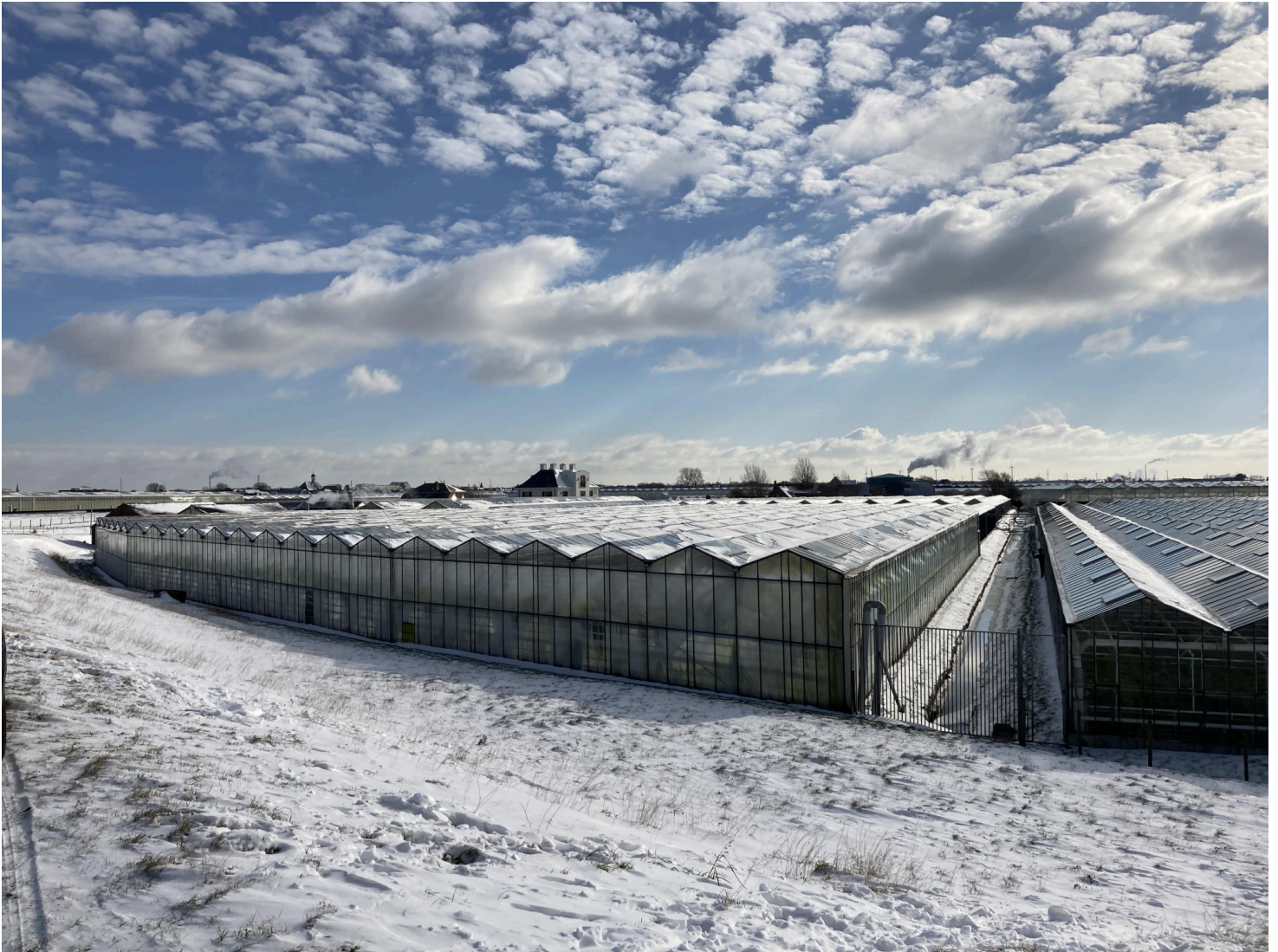
In Nederland bracht het gewicht van het sneeuw schade teweeg bij de serres