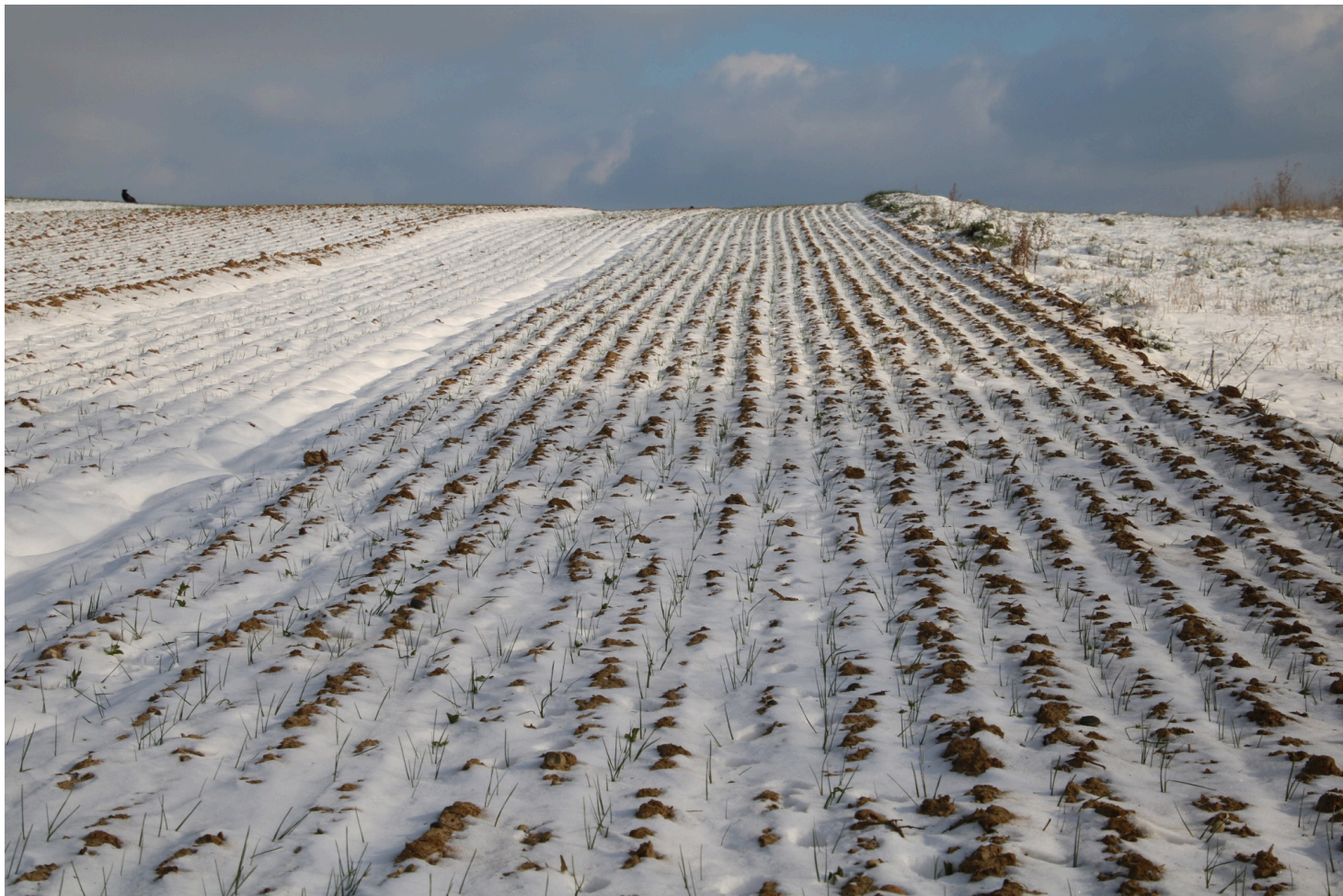
Wintertarwe in het Pajottenland onder een laag sneeuw

AVBS meent dat de strenge winter misschien ook positieve gevolgen heeft. Men heeft heel de winter goed kunnen doorwerken en door de strenge vorst ligt de handel momenteel stil omdat bijvoorbeeld de tuinaanleg op een laag pitje draait. "Maar dit stelt bedrijven juist in de gelegenheid om hun aandacht te vestigen op zaken die anders misschien zouden blijven liggen, zoals onderhoud van machines, online vergaderen en administratie bijwerken", besluit Verschoren.