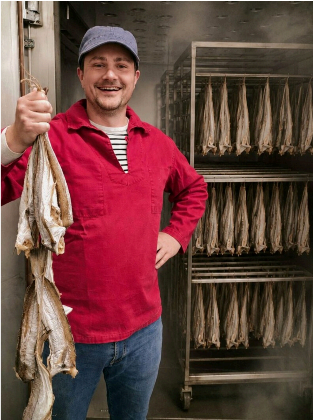
De Brugse Visrokerij Alloo mag zijn 'droogvis' nu officieel streekproduct noemen.