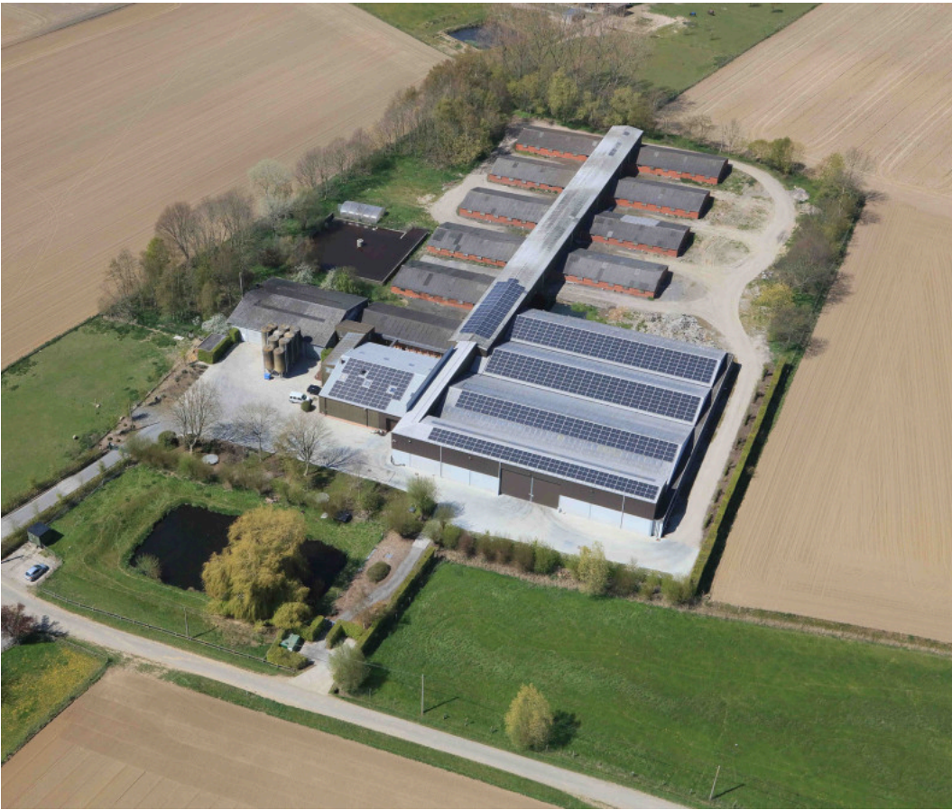
Luchtfoto van de site in Poelkapelle