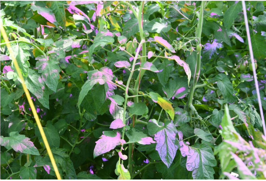
De lichtfilters van de zonnepanelen laten een paarse gloed na op de tomaten.