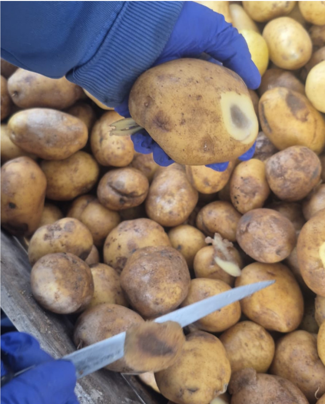
Drukplekken bij aardappelen