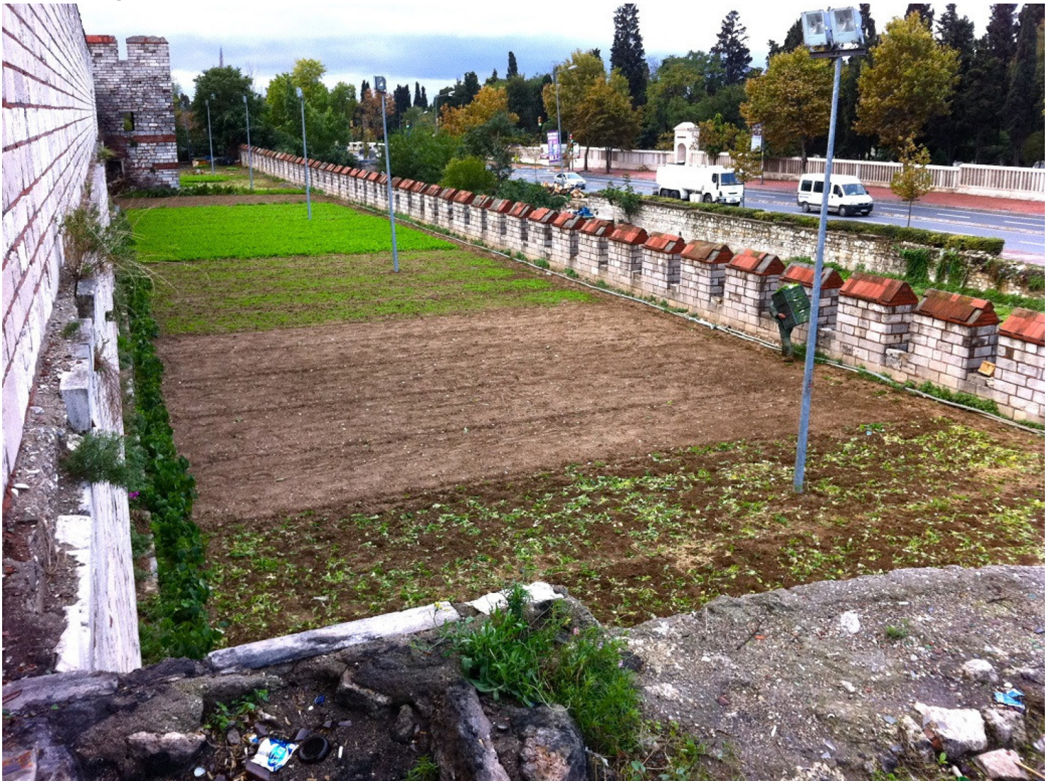
Stadslandbouw in het centrum van Istanbul

“Stadslandbouw is van alle tijden”, vertelt Frank Lohrberg, van de universiteit van Aachen, terwijl hij een foto laat zien van een stuk open grond in het centrum van Istanbul nabij de stadswal die van de vijfde eeuw dateert. In de Turkse stad bestaat een bloeiende handel rond de stadstuin waarbij de tuiniers hun groente en fruit op de lokale markt verkopen. Ook een stad als Milaan heeft een zeer omvangrijke groene open ruimte waar stadslandbouw plaatsvindt.