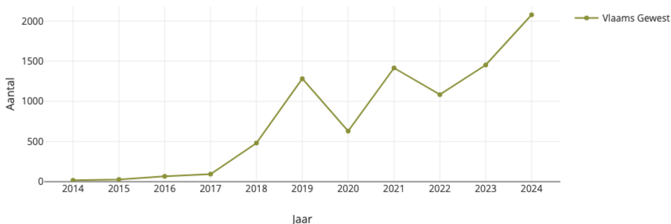
Evolutie schadegevallen voor wild zwijn in Vlaanderen van 2014 tot 2024

Jaarlijks totaal aantal schadegevallen voor wild zwijn in Vlaanderen