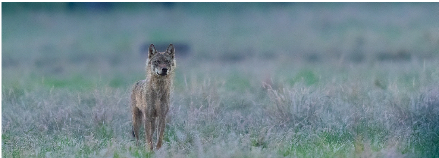
Wolf Billy was in juni 2020 nog in België

Billy was in juni 2020 nog gespot in de Kempen. “Maar wolven zijn extreem mobiele dieren die grote afstanden kunnen afleggen tijdens langdurige omzwervingen, zeker wanneer ze een eigen leefgebied zoeken. Deze wolf legde op vier maanden tijd in vogelvlucht minstens 1000 km af”, aldus Koen Van Muylem van INBO.