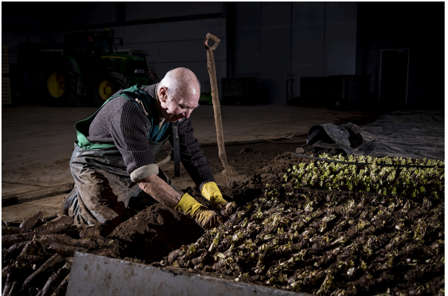
Grondwitloof vraagt best wat handenarbeid, maar het resultaat mag er wezen.

Grondwitloof is gebonden aan de seizoenen, en zal je dus eerder vinden in de periode