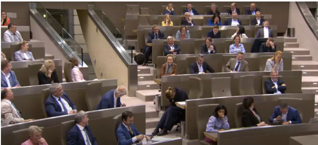
Een niesbui bracht het parlement in de vroege uurtjes nog even aan het lachen.

Omdat er discussie ontstond over het precieze advies van de experts, werd de zitting om 00.49 uur geschorst. Zes minuten later werd ze hervat, maar om 1.51 uur werd ze wederom geschorst omdat Vooruit een inhoudelijke reactie vroeg op haar amendementen, die de minister nog tijdens de vergadering diende te lezen. “Wij worden verwacht om 500 bladzijden te bespreken in minder dan geen tijd. Wij dienen vier amendementen in. Dan is het toch niet meer dan normaal dat ik vraag wat de reactie daarop is?”, zei een geagiteerde Verbeurgt.