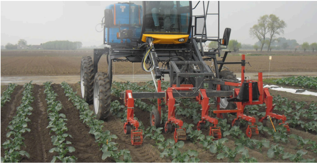
Mechanische onkruidbestrijding

Viaverda wil intensief samenwerken met alle niveaus: van toeleveranciers, telers, groenvoorzieners en sectororganisaties tot handel, verwerking, overheden en andere kennisinstellingen. Viaverda zal vanuit haar twee sites, in Destelbergen en Kruisem, de Vlaamse land- en tuinbouwer en groenvoorziener ondersteunen. De infrastructuur in Destelbergen bevindt zich midden tussen de voornaamste teeltgebieden in bloemisterij en boomkwekerij en is volledig afgestemd op onderzoek en demonstratie in sierteelt en groenvoorziening. In Kruisem sluit de site mooi aan bij de teeltgebieden in groenten en aardappelen en is er infrastructuur voor zowel openluchtteelten als groenteteelt onder bescherming, met een labo voor bodemanalyses. Zowel het smaakonderzoek als de veldproeven gewasbescherming kunnen onder GEP-accreditatie worden uitgevoerd. Ten slotte legt Viaverda ook proefplatformen aan bij telers om praktijkdata te verzamelen in andere bodemtypes of teeltgebieden.