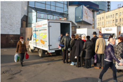
Melkverkoop in Kiev voor de oorlog