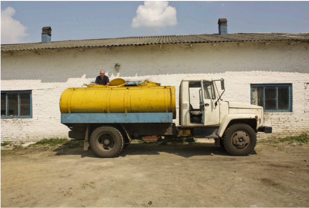
Melkophaling bij een melkveebedrijf nabij Kiev voor de oorlog