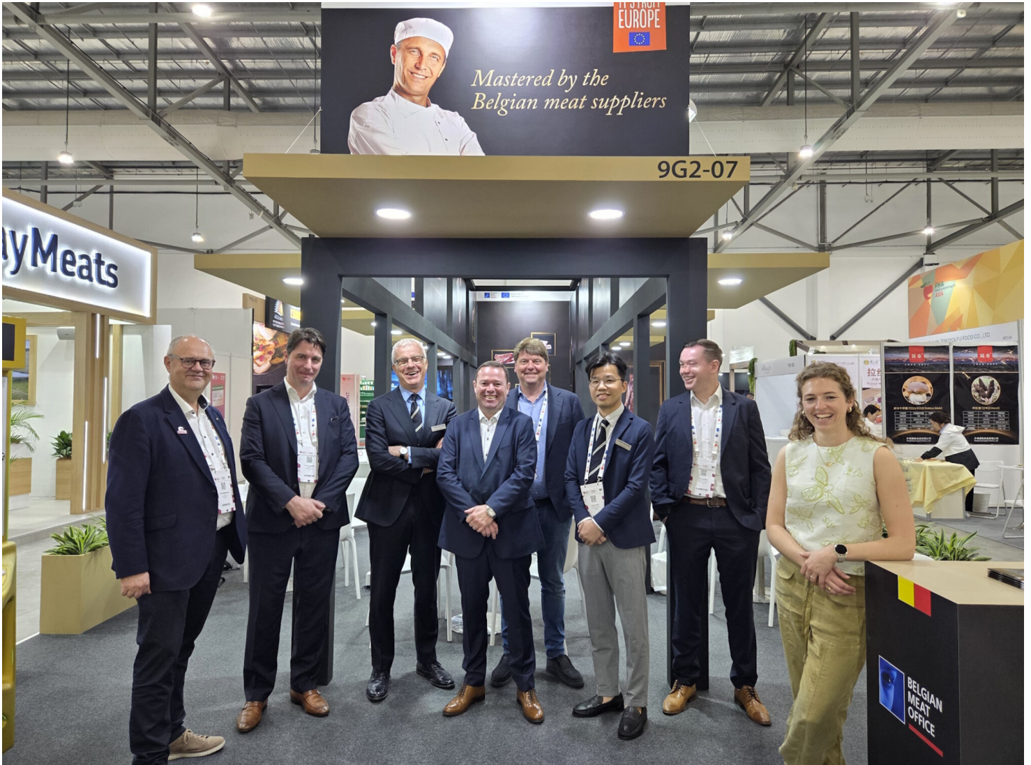
De Belgische varkensvleesexporteurs promoten hun producten in Singapore. 24 procent van de Belgische export van eetbare varkensslachtafval gaat naar Azië.

De algemene tevredenheid bij de deelnemende bedrijven was groot. “De deelname aan FHA in Singapore bleek bijzonder waardevol om de positie van Belgische voedingsbedrijven in de Aziatische markt te versterken, nieuwe exportkansen te verkennen en duurzame relaties met internationale partners op te bouwen”, meldt VLAM nog. Voor internationale leveranciers fungeert FHA als een strategische toegangspoort tot de bredere Aziatische regio.