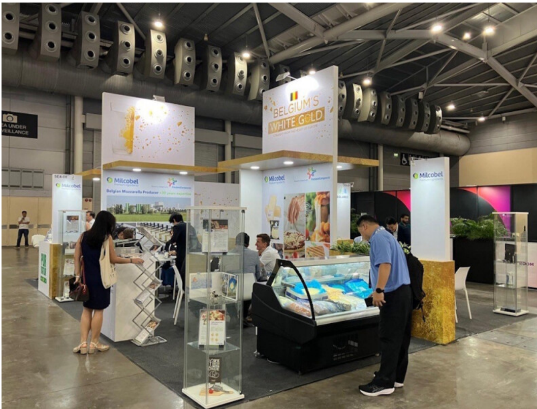
Mozzarella is een gegeerd product in Azië, niet alleen voor westerse gerechten maar ook binnen de eigen keuken.

De vraag naar mozzarella is niet min in Azië. “Ten dele door de verwestering van de eetgewoonten”, zegt Janssens. “Maar dit ingrediënt is ook aanwezig in vele Aziatische gerechten. Het is een milde kaas met veel functionaliteit. In Korea bijvoorbeeld is het een veelgebruikte kaas om de pittigheid van bepaalde gerechten af te remmen. Bovendien houdt men van de funfactor en de stretch van dit product. Mozzarella wordt dus ook vaak gebruikt voor het maken van streetfood zoals corn dogs, een type hotdog omringd met een kaaslaagje.”