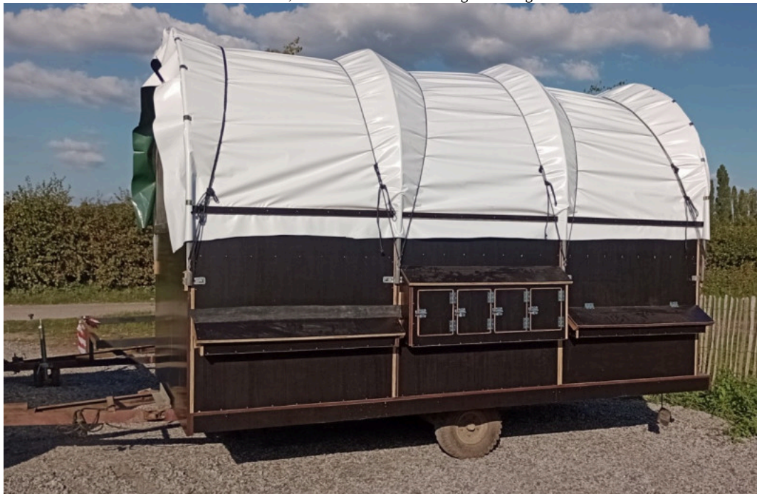
Mobiele kippenstal van Boer Bricoleur

wens kan combineren. Doordat het modulair is, kan het voor verschillende groottes ingezet worden en is er voor elke boer wat wils”, verklaart Vandergeynst.