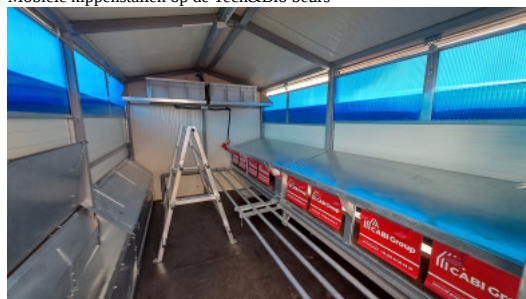
Mobiele kippenstallen op de Tech&Bio beurs