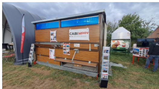
Mobiele kippenstallen op de Tech&Bio beurs