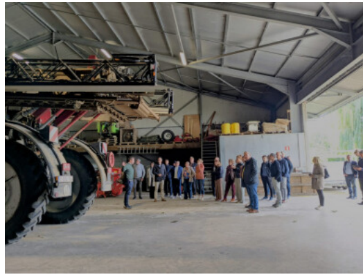
Vlaamse parlementsleden tijdens informatiesessie over gewasbescherming op de 'Beenshoeve'