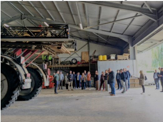
Vlaamse parlementsliden tijdens informatiesessie over gewasbescherming op de 'Beenshoeve'