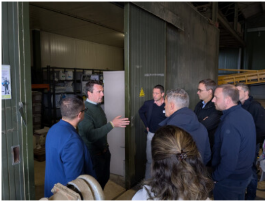
Vlaamse parlementsleden tijdens informatiesessie over gewasbescherming op de 'Beenshoeve'