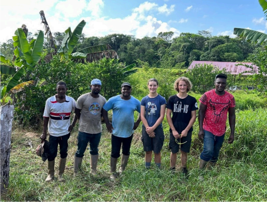
Twee VLTJ-leerlingen in Frans-Guyana met het personeel van de stagegever.

Inghelbrecht. “Bijgevolg zijn de prijzen voor voeding in de winkels heel hoog, is er veel invoer uit moederland Frankrijk en zijn veel landbouwbedrijven naar West-Vlaamse normen er op niveau van keuterbedrijfjes, zowel qua schaalgrootte als qua efficiëntie. Veel bedrijfjes kweken veel verschillende teelten en dat deels voor eigen consumptie.”