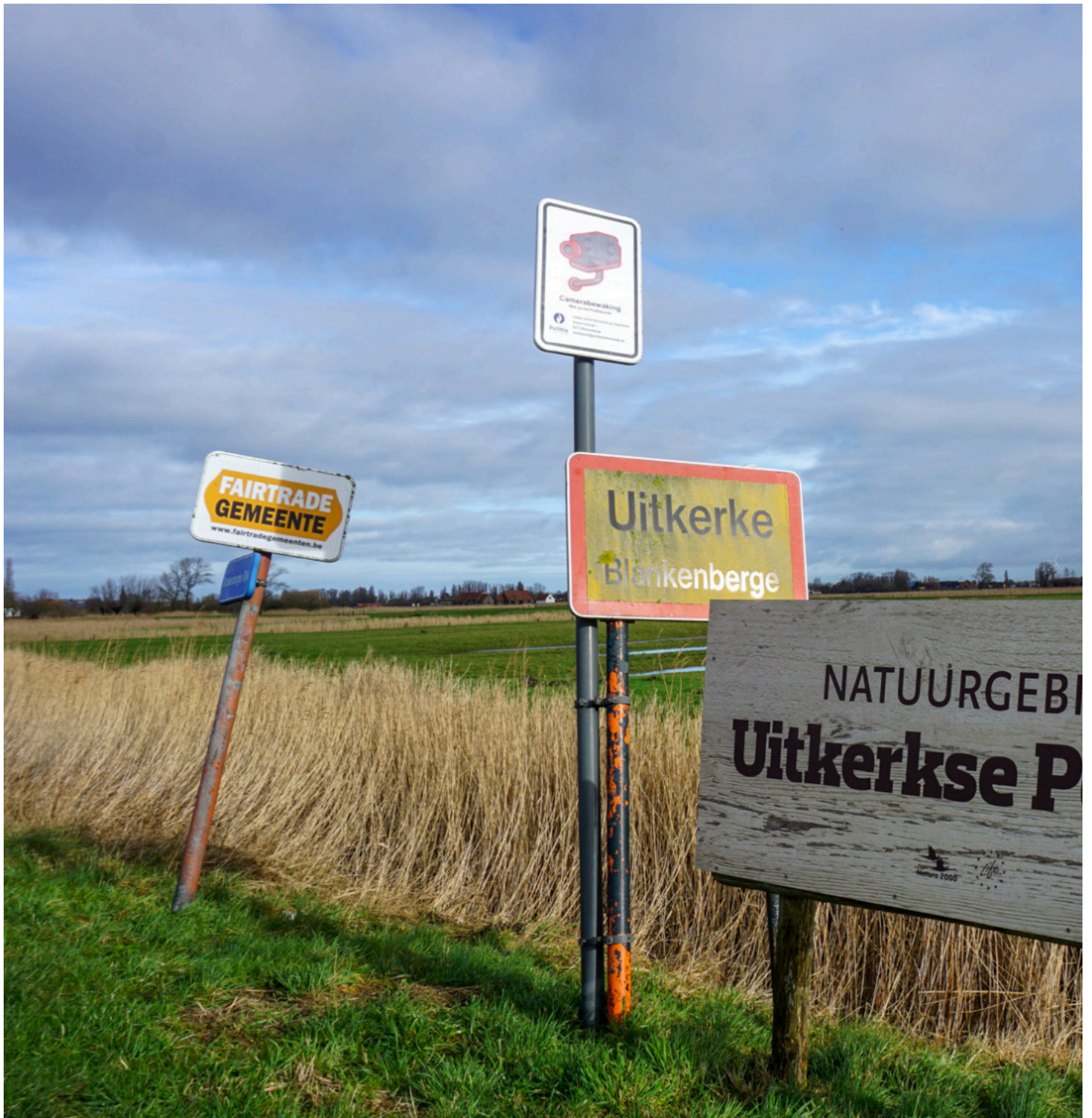
Anonieme bronnen zijn bekend bij de redactie.