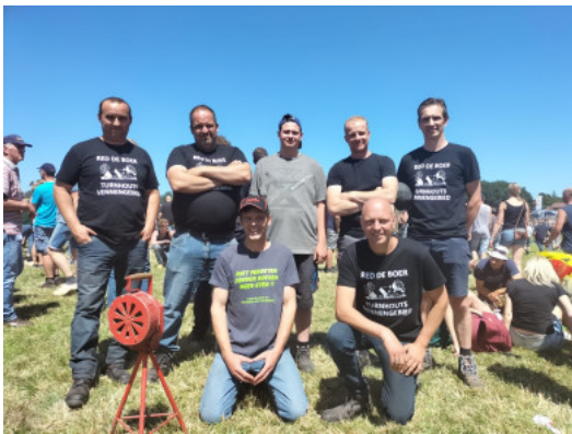
Eén van de Vlaamse delegaties op het stikstofprotest in Nederland

Door hitte heeft gemeente Barneveld gevraagd het programma in te korten.