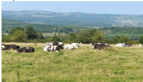
Boeren in Wallonië