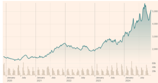
ICE EU Robusta coffee futures chain (dollar/pond)

Extreme weersomstandigheden in Brazilië en Vietnam hebben de prijzen sinds 2023 sterk opgedreven. De twee zijn 's werelds grootste koffieproducerende landen en zijn samen goed voor ongeveer de helft van de wereldwijde productie. Brazilië levert vooral