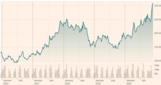
ICE US Arabica coffee futures chain (dollarcent/pond)

De koffieprijs zit al sinds september 2023 in de lift. Dit jaar alleen al werd arabicakoffie meer dan 70 procent duurder, met een stijging van 11 procent in de laatste zeven dagen. Op dinsdag steeg de prijs op de termijnmarkt van de grondstoffenbeurs (ICE;US) naar meer dan 3 dollar per pond, wat ongeveer neerkomt op 6 euro per kilogram. De prijs van koffie op de grondstoffenbeurs staat niet per se gelijk aan de invoerprijzen van koffie. Het wordt eerder gezien als een benchmark voor de wereldwijde koffiemarkt die niet alleen vraag en aanbod weerspiegelt, maar ook rekening houdt met weersomstandigheden, geopolitieke ontwikkelingen en speculatie.