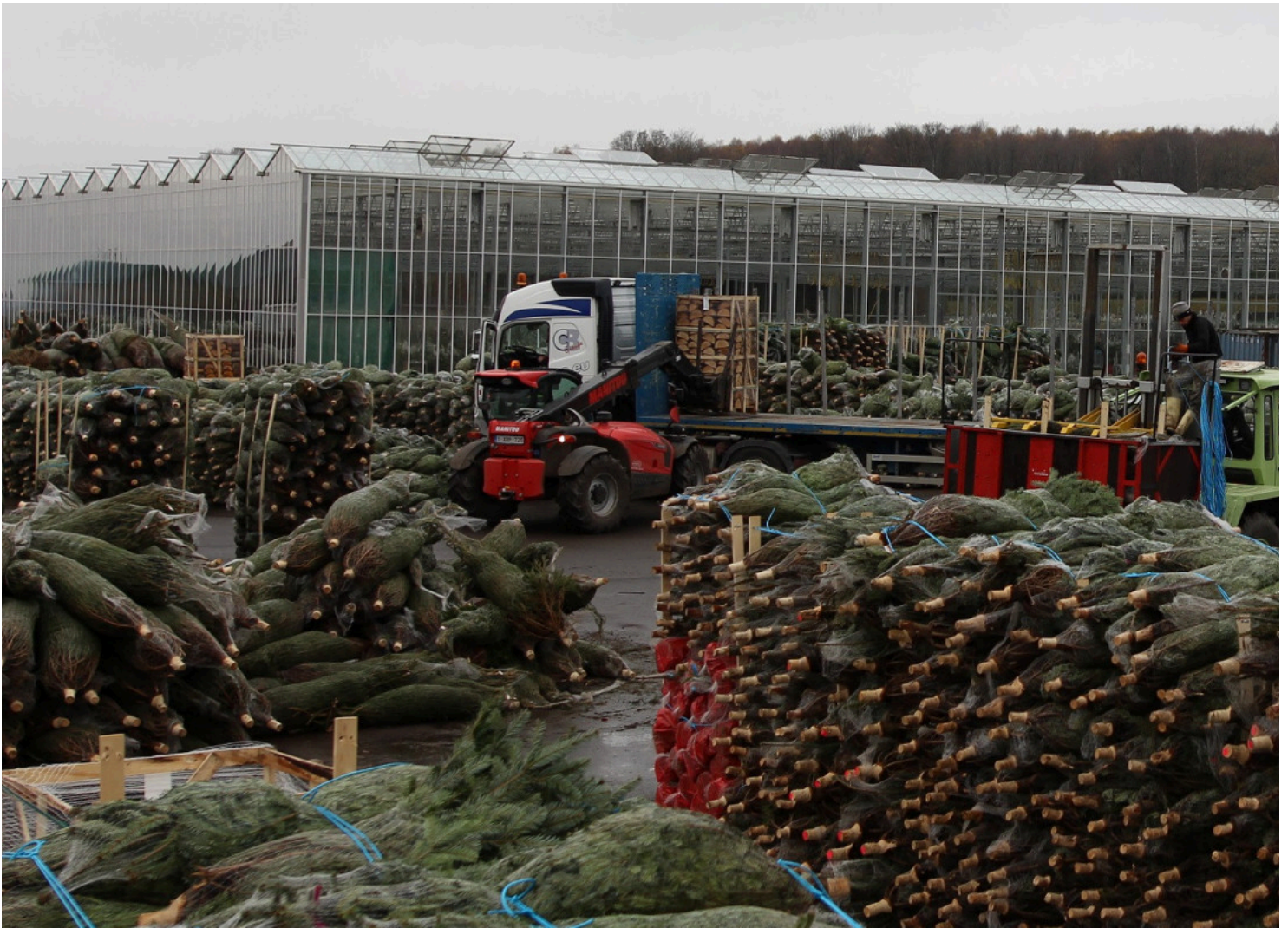
Greencap behoort met 1 miljoen bomen per jaar tot de grootste telers van België.

In Vlaanderen is de teelt dus beduidend kleiner, maar brengt het eveneens geld in het laasje. Volgens Verschoren biedt elke Vlaamse boomkweker die aan thuisverkoop doet, ook kerstbomen aan. “De verkoop van kerstbomen mag niet onderschat worden. Het maakt in Vlaanderen 10 tot 12 procent van de omzet uit in de boomkwekerij. Eén op de twee gezinnen heeft een boom staan en voor sommige consumenten is het de enige keer in het jaar dat ze naar een boomkweker of tuincentrum gaan.” Vooral in sinds de uitbraak van het coronavirus, waardoor de boomkwekerij gouden tijden doormaakt, is de kerstboomverkoop een kers op de taart. “Zie het als een soort van dertiende maand”, zegt Verschoren met een knipoog.