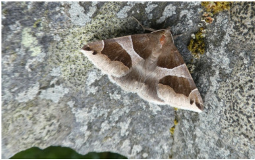
Bruine Prachtuil