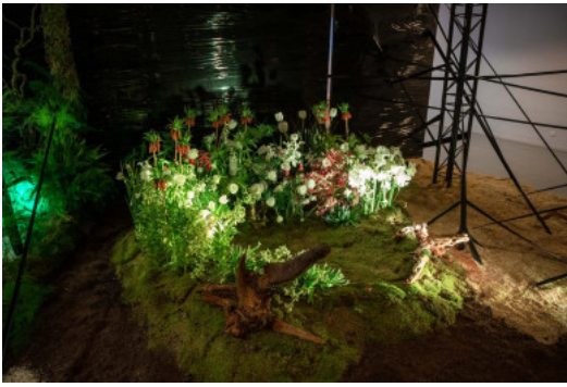
Tuinontwerp van Alona Malafeieva