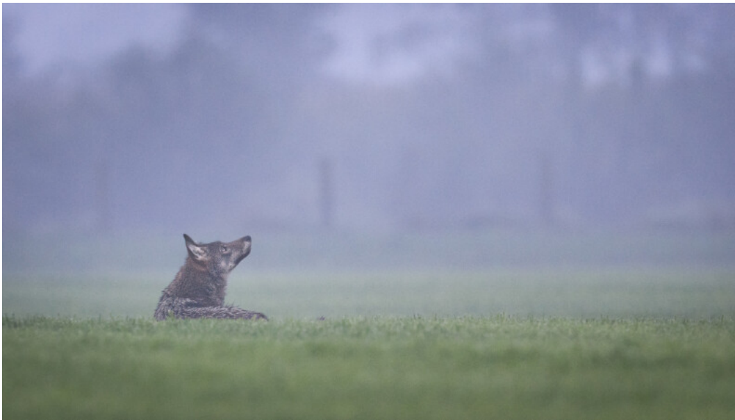
Een wolvenwelp in Peer

De overheidsdienst bakende een permanente wolvenaantwezigheidszone af om veehouders in het leefgebied van de wolf te begeleiden. Het voorlopig afgebakende territorium van 25.600 hectare ligt op het kruispunt van de gemeenten Saint-Hubert, Nassogne, Tenneville, Sainte-Ode, Libramont en Tellin. Experts verwachten dat het wolvenkoppel in het voorjaar van 2026 de eerste welpen zal krijgen.