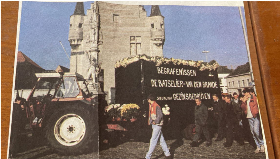
Op 3 november 1993 protesteerden boeren eerder voor de mestbank in Herentals.

Als landbouwbestuurder heeft Heylen de politieke beleidsvoering van dichtbij meegemaakt. Het wordt de landbouwsector steeds moeilijker gemaakt, vindt de bestuurder-melkveehouder die woensdag ook aanwezig was bij de boerenactie in Herentals. Daar plaatsten meer dan 100 boeren een kruis voor de Mestbank. Met de symbolische actie wilden de boeren hun ongenoegen uiten over het concept mestactieplan (MAP7) dat recent uitlekte.