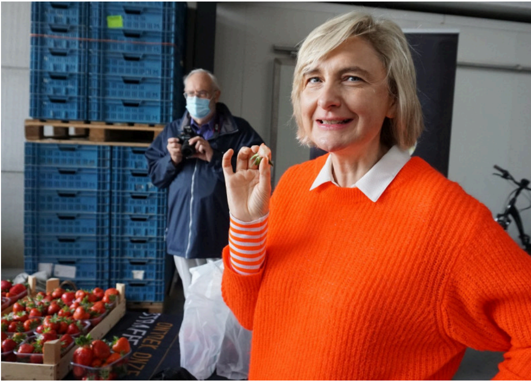
Een goedkeurende blik van minister Crevits, die de zelfgeplukte vollegronddaarbeien mocht proeven

“De goesting in lokale voeding is groter dan ooit”, merkt ook Landbouwminister Hilde Crevits. “En die moeten we blijven vasthouden. De verkoop van aardbeien en asperges bijvoorbeeld schoot in de lucht. Door al voor de vierde keer deze week van de korte keten te organiseren, willen we de Vlaming overtuigen om deze (her)ontdekking te koesteren en blijvend lokaal te kopen.”