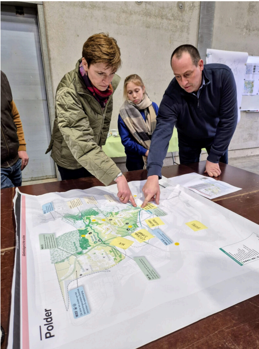
Boeren tonen hoe landbouw in gedrang komt door plannen in Ettenhoven- Muisbroekse polders