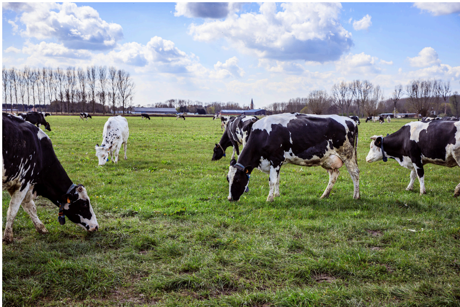
Beweiding in de biologische melkveehouderij