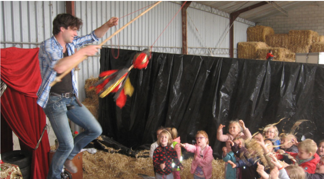
Boerenbond neemt jaarlijks zo'n 45.000 kinderen mee op Plattelandsklassen.

“Onze workshops geven we gratis”, zegt De Greef tot slot. “We vragen een vrijblijvende bijdrage, maar de meeste scholen doen dat niet. Zeker niet in Wallonië, waar ze minder budget hebben. In tegenstelling tot de boeren krijgt GAIA trouwens nul euro subsidie. Al wat we doen, gebeurt via lidgelden en testamenten van de mensen.”