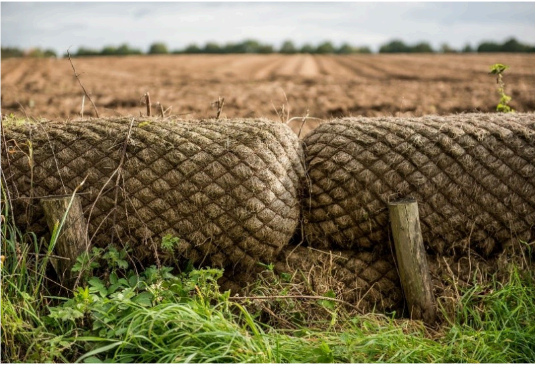
Kokosbalendam in Oost-Vlaanderen