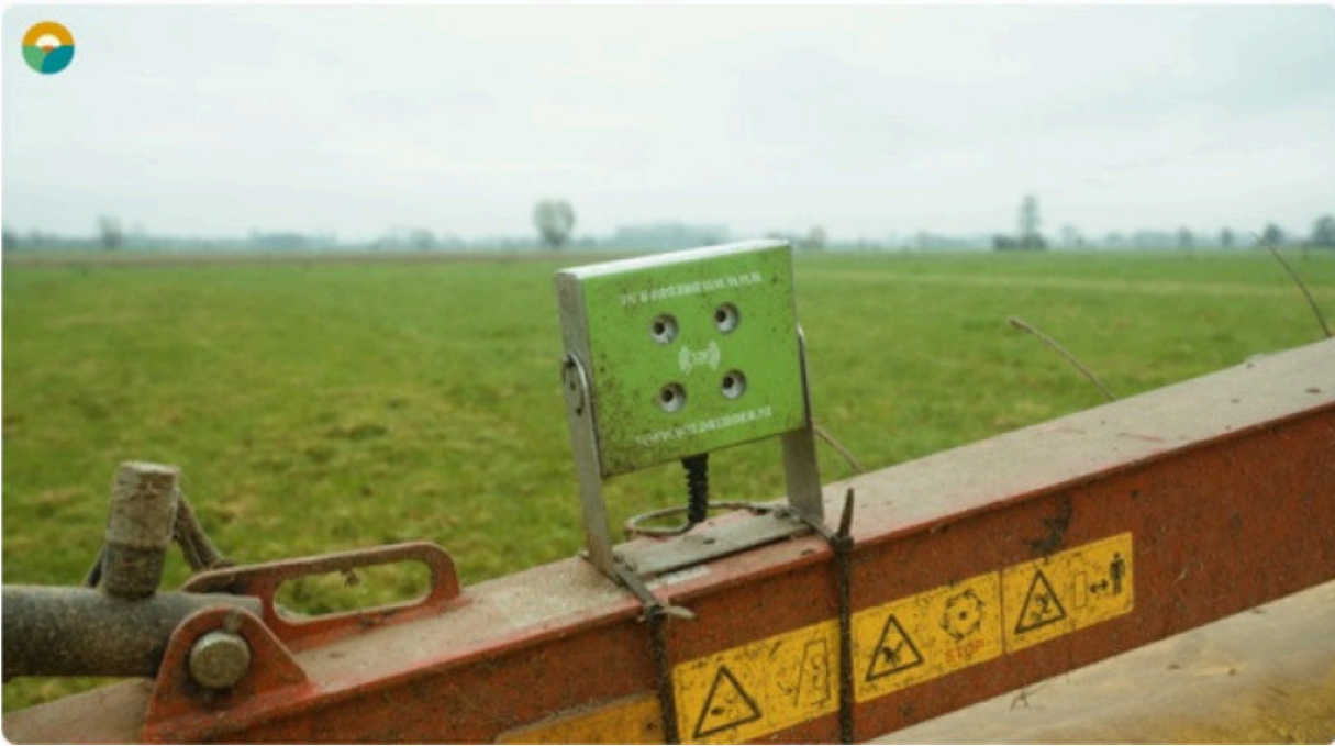
Akoestische wildredder in werking op de maaibalk

Wildredders zijn hulpmiddelen die ervoor zorgen dat fauna uit het veld wordt gejaagd tijdens het maaien. Er bestaat een akoestische en een mechanische wildredder. Een akoestische wildredder maakt een vreemd geluid dat in tegenstelling tot het geronk van de tractor niet constant is en op die manier dieren verjaagt. Dit toestel is zeer gebruiksvriendelijk en kan je makkelijk aan en uit zetten vanuit de cabine. Het wordt geleverd met een sterke magneet zodat het op de maaier blijft staan.