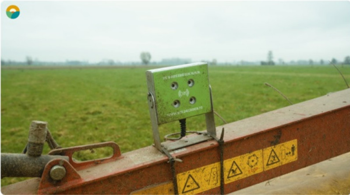
Akoestische wildredder in werking op de maaibalk

Wildredders zijn hulpmiddelen die ervoor zorgen dat fauna uit het veld wordt gejaagd tijdens het maaien. Er bestaat een akoestische en een mechanische wildredder. Een akoestische wildredder maakt een vreemd geluid dat in tegenstelling tot het geronk van de tractor niet constant is en op die manier dieren verjaagt. Dit toestel is zeer gebruiksvriendelijk en kan je makkelijk aan en uit zetten vanuit de cabine. Het wordt geleverd met een sterke magneet zodat het op de maaier blijft staan.