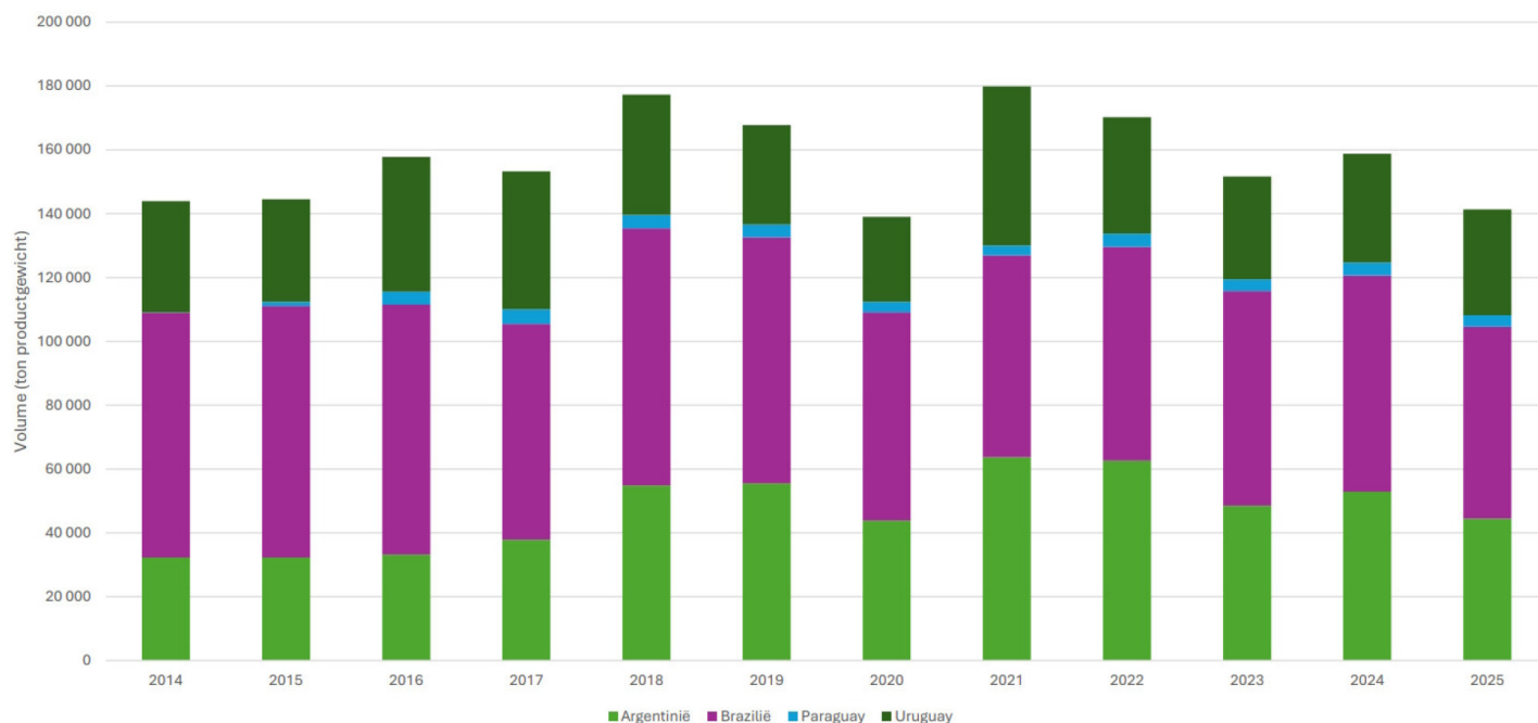
Invoer rundsvlees door EU uit Mercosur