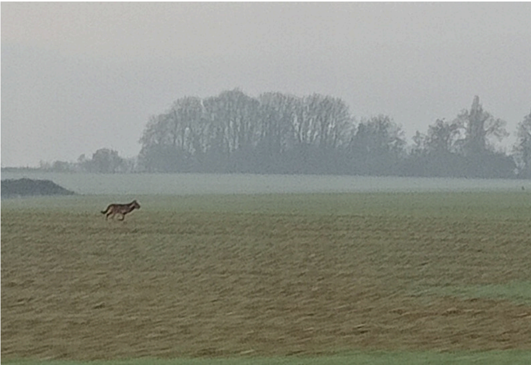
Wolf op Plateau van Tervuren_10 februari 2023 om 8u43

Welkom Wolf vermoedt dus dat het om twee verschillende wolven gaat en dat beide wolven uiteindelijk via de Dijlevallei verder naar het zuiden zijn gelopen en dat ze zich inmiddels - apart van elkaar - al in Wallonië (of nog verder) bevinden. Op 14 februari kreeg de organisatie een nieuwe melding vanuit Bierbeek, maar hierbij is het de vraag of het wel om een wolf gaat.